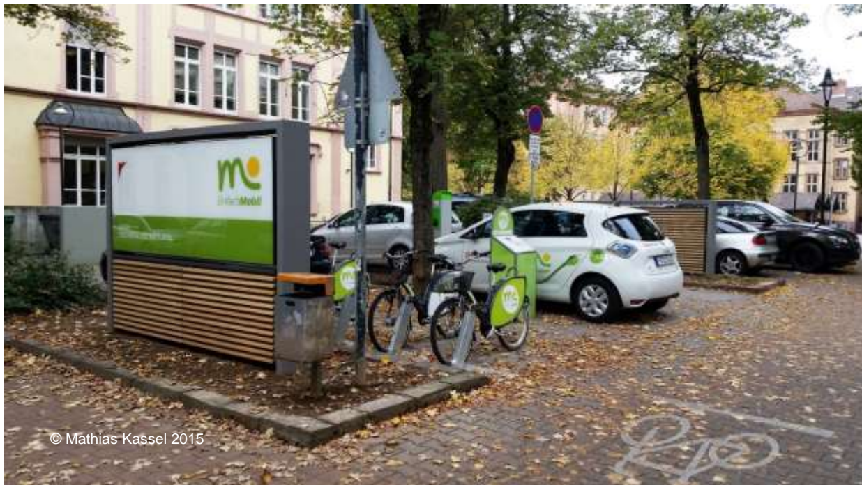
Station Technisches Rathaus